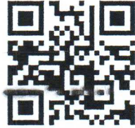
Mã QR nộp bài

- Link nộp bài: https://easychair.org/cfp/INCOSEF2025