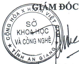
Tăng Phú An