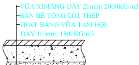
HÌNH 1 – CÁC LỚP CẤU TẠO SÀN